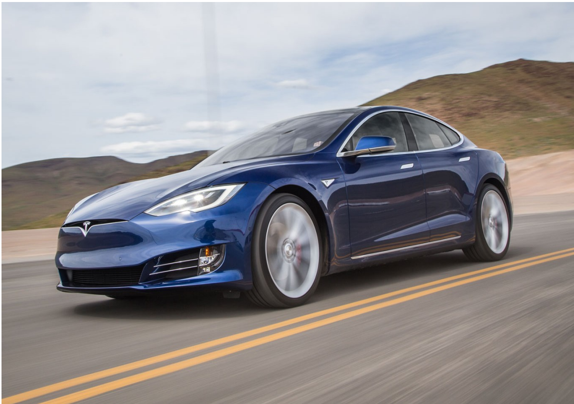
Tesla Model S: Een volledig elektrische personenauto

De datum van dit Informatie Memorandum is 20 december 2017. Indien nieuwe informatie na het uitkomen van dit Informatie Memorandum leidt tot feitelijke en materiële afwijkingen van de in dit Informatie Memorandum opgenomen uitgangspunten en aannames zal hierover zo spoedig mogelijk worden bericht.