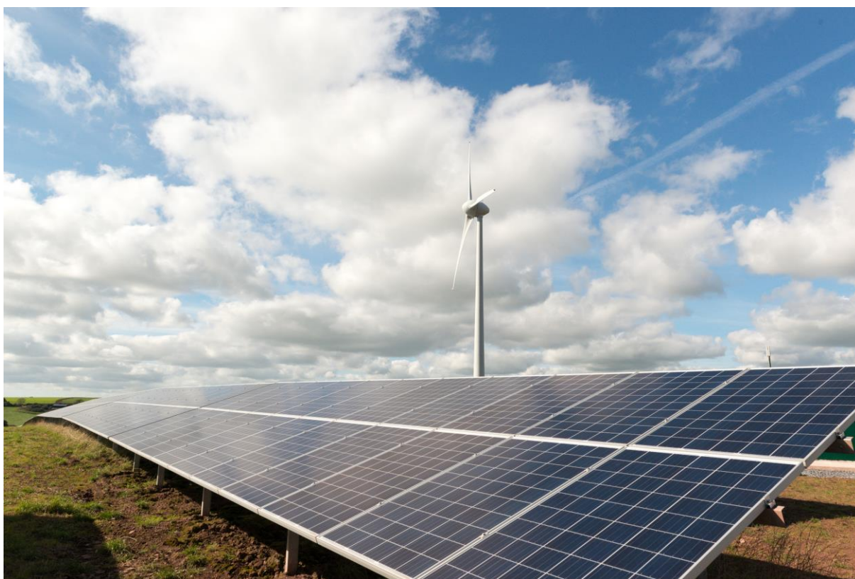
Foto: Vattenfall zonnepark Cynog in Wales

Let op! U belegt buiten AFM-toezicht. Geen prospectusplicht voor deze activiteit.