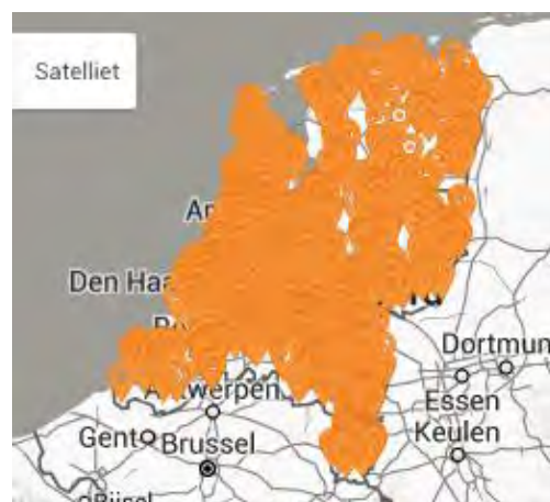
Afbeelding: Overzicht van geplaatste Zonnestroom-systemen door Zelfstroom Installaties per 1-8-2016

Onder alle klanten voert Zelfstroom structureel een klantentevredenheidsonderzoek uit. Van de huidige klanten beveelt 92% Zelfstroom aan bij vrienden, kennissen en of familie.