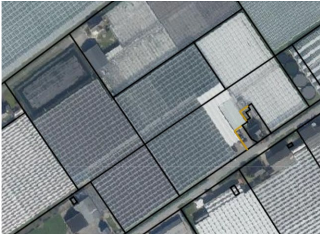
Figuur - Locatie