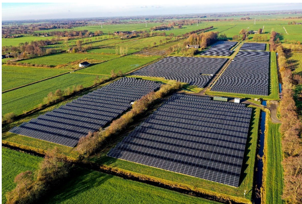
Oppervlakte van Grond Leeksterveld: Twee percelen van in totaal 130.774 m 2

Grond Geesteren De totale oppervlakte is 9,7 ha en het zonnepark, Zonnig Berkelland, is 12,9 MW. De opstalovereenkomst is voor 30 jaar en startte in april 2021. De erfpacht bedraagt 9,2 €/ha en is geïndexeerd met 1%.