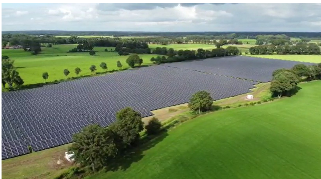
Oppervlakte van Grond Geesteren: Twee percelen van in totaal 97.014 m 2