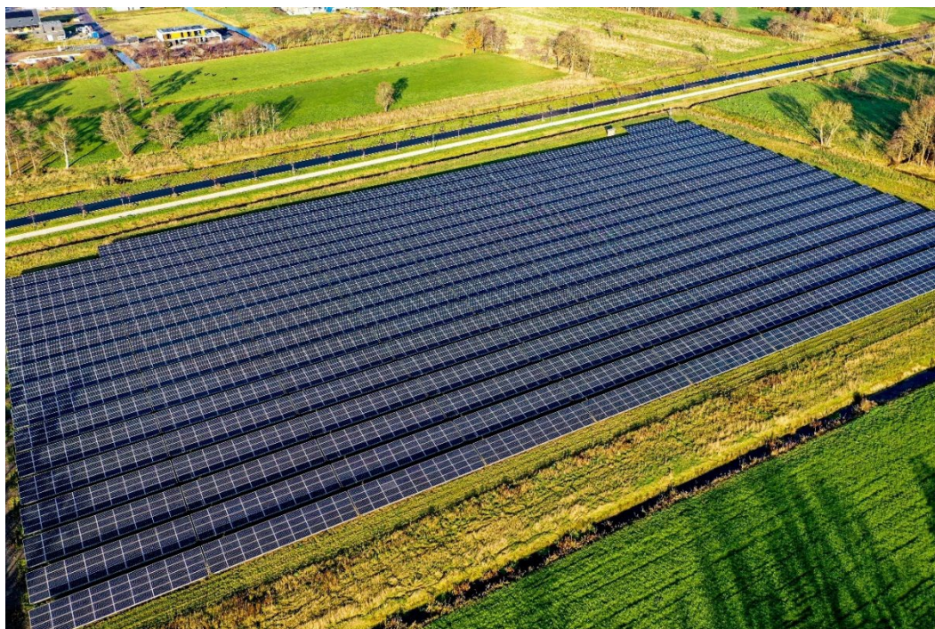
Oppervlakte van Grond Leek Oostindie: Een perceel van in totaal 29.190 m 2