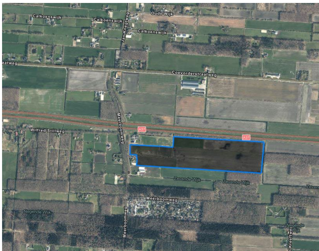
Figuur – Grond Locatie I