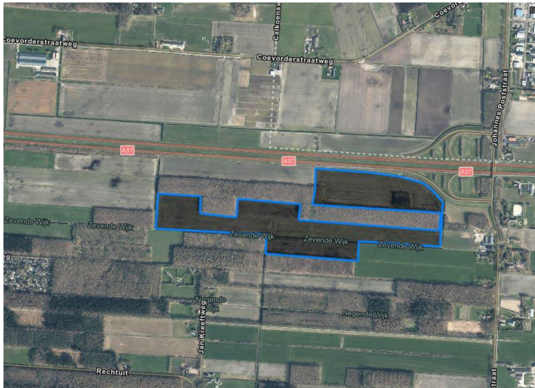
Figuur – Grond Locatie II