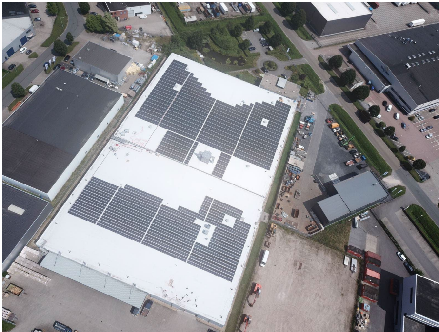
Figuur 1: Winterswijk 800kWp operationeel

Trio Investment heeft een sterke marktpositie in de agro-markt, waarbij de daken van stallen, schuren en kassen waarop zij Zonnestroomsystemen kan realiseren steeds vaker aan haar worden verhuurd. Verder heeft Trio Investment een sterk netwerk van partners met andere ontwikkelaars, financiers en kennisinstellingen.