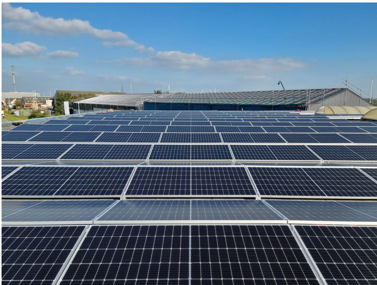
Foto: installatie van een recent door Volgroen gerealiseerd Zonnestroomsysteem bij Holland Boat in Workum.

Volgroen verwacht de komende jaren veel van dit soort projecten te realiseren en heeft inmiddels een team van professionals opgebouwd voor de ontwikkeling, realisatie en het beheer van de zonnestroomsystemen en om verdere groei van haar portefeuille te realiseren.