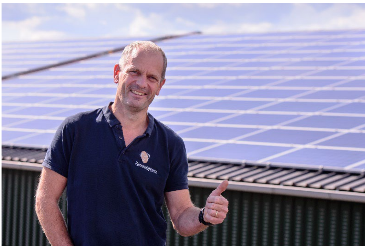
Foto: Zonnestroomsysteem bij Pluimveebedrijf Ermens

Een nadere toelichting over het inschrijvingsproces is opgenomen in hoofdstuk 9 ( Deelname Obligatielening ).