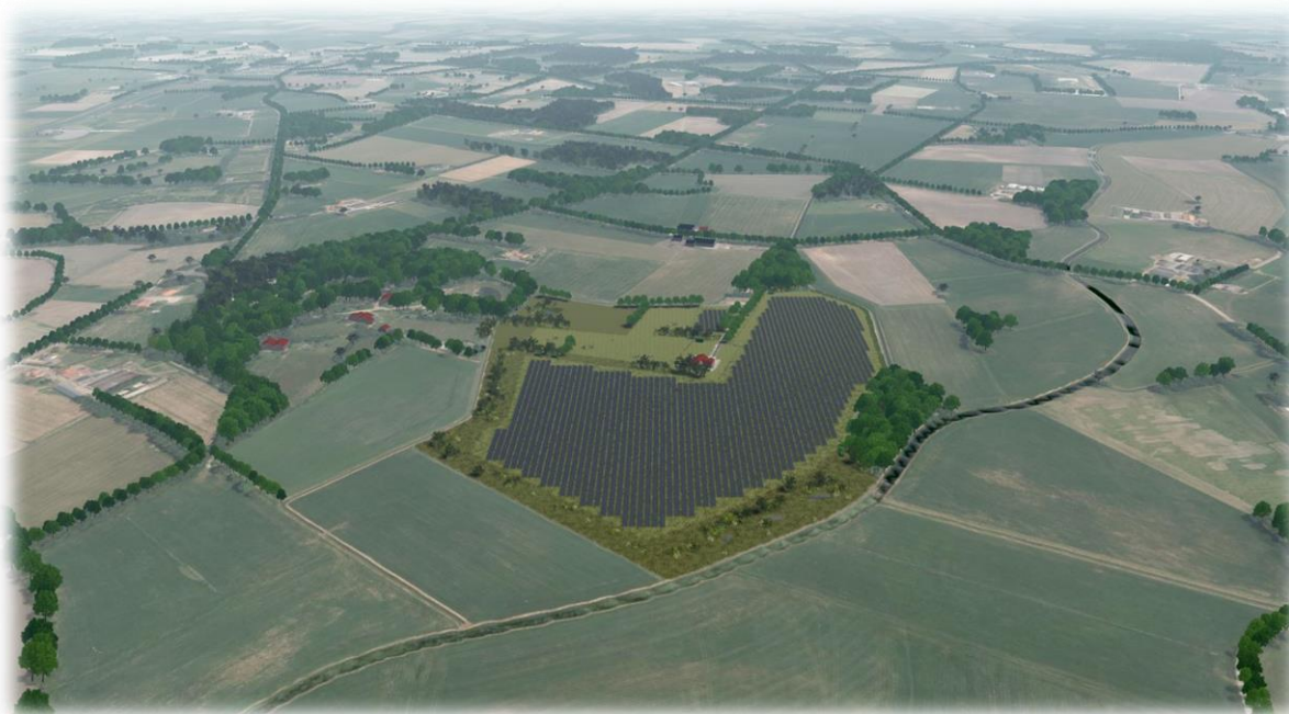
Impressiefoto van Zonnepark Dievelman, onderdeel van de Portefeuille Zonnestroomprojecten omschreven in dit Informatiememorandum.

Het Informatiememorandum wordt gepubliceerd in verband met de aanbieding en uitgifte van in totaal maximaal 1.500 Obligaties van €1.000 nominaal per stuk voor een totaal van maximaal €1.500.000 door IX Zonnig B.V. (de Uitgevende Instelling) ter herfinanciering van een deel van de door de Uitgevende Instelling gemaakte ontwikkelkosten voor de Portefeuille Zonnestroomprojecten zoals beschreven in het Informatiememorandum.