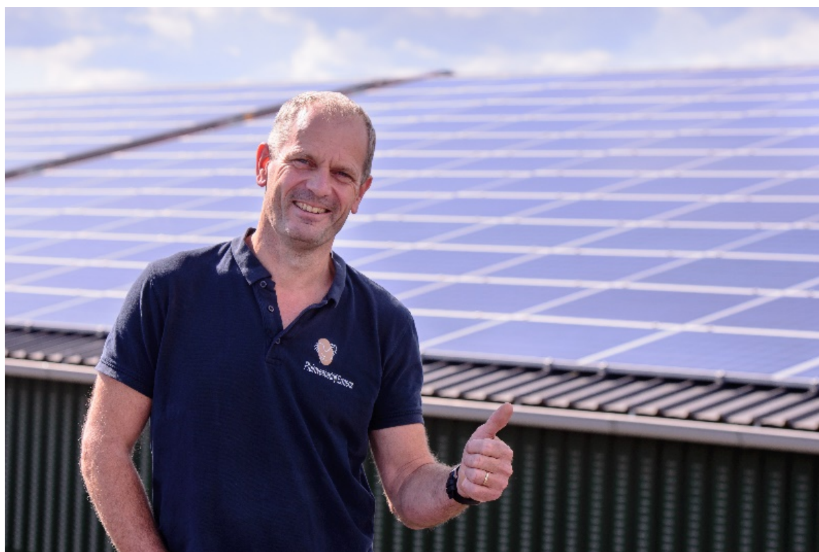
Foto: Zonnestroomsysteem bij Pluimveebedrijf Ermens

Een nadere toelichting over het inschrijvingsproces is opgenomen in hoofdstuk 9 ( Deelname Obligatielening ).