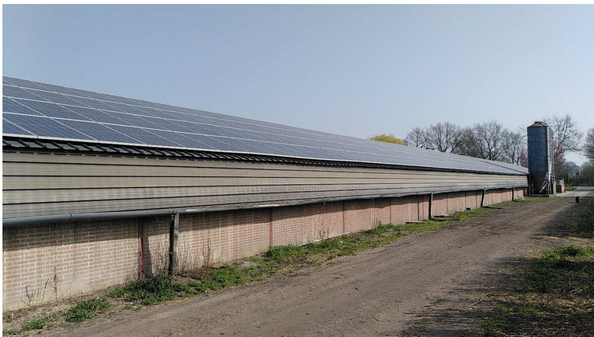
Foto: Volgroen Zonnestroomsysteem van 160 kWp bij een pluimveehouderij.

Indien de Obligatie door een besloten vennootschap (of een andere voor de vennootschapsbelasting belastingplichtige entiteit) wordt gehouden, zullen de met de Obligatie behaalde resultaten in beginsel belast worden bij de besloten vennootschap tegen het vennootschapsbelastingtarief van maximaal 25,0% (tarief 2021). Onder voorwaarden zijn de betaalde transactiekosten ten laste van de winst te brengen en de op Transactiekosten betaalde BTW te verrekenen.