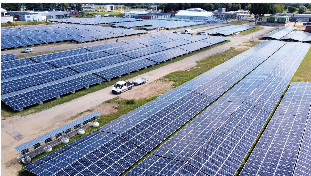
Foto: Zonne-energieproject Solvay Chemie B.V.

Het Informatiememorandum wordt gepubliceerd in verband met de aanbieding en uitgifte van in totaal 400 obligaties van €250 nominaal per stuk voor een totaal van €100.000 door International Solar Projects IV B.V. (de Uitgevende Instelling ).